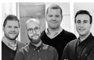
DNBS OPPSTARTSLOS Vi jobber med bedrifter i start- fasen og helt inn i vekstfasen.