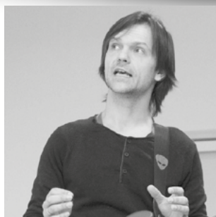
ARE BRANSTAD «Rock og innovasjon»

TID: Torsdag 24.11.2016 09.30-14.30 STED: Klækken Hotell, Hønefoss PÅMELDING: Innen mandag 14.11.